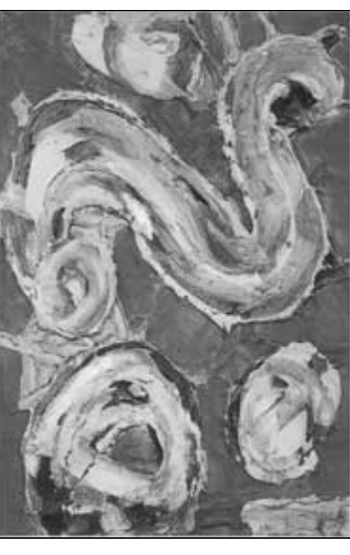
Un'opera di Pinot Gallizio in mostra a Genova

tore, con Jorn, di quel Bauhaus immaginista che si proponeva di controbattere con l'irrazionalità il progetto della scuola di Weimar, Dessau e Berlino, laddove l'istituto di Gropius si era affidato alla progettazione tecnologica in progresso, e propriamente le idee di Max Bill e della nuova Bauhaus di Ulm. Il "mondo peggiore" vaticinato da Gallizio - farmacista, chimico, enologo, archeologo, capo degli zingari e, soprattutto, consapevole della propria dimensione fantastica - era quello pur coinvolto dal progresso ma liberato di quei "condensatori sociali" che l'ideologia del movimento logico di Gropius aveva annunciato in Germania, attorno al '28. La pittura di Gallizio, che cercava di astrattizzare, come subito avvertì Calvesi "le movenze fantomatiche del grottesco di Cobra, alludendo come ad un ricongiungimento estremo di biologia e di favola", dopo aver conosciuto le possibilità dell'opera collettiva, fondava i modi del proprio linguaggio nell'incontro tra l'organicità della materia e uno schema formale dall'andamento "spirale". La Galleria Martini & Ronchetti, che già nel 1975 e nel 1988 aveva presentato mostre personali di Gallizio, consente ora la pubblica genovese di mettere a fuoco l'aspetto preminente di una ricerca da valutare in termini psicologici, sociologici e fantasiosamente popolari oltre che propriamente pittorici.