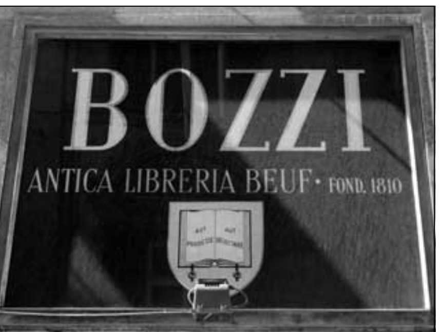
L'insegna della Bozzi i cui locali sconfinano in un chiostrò medioevale

E altre volte fa vendere con piacere, indipendentemente dal prezzo, un volume antico e molto amato, come nel caso di quel bellissimo esemplare dei famosi Palazzi di Genova del Rubens, dal quale si separò volentieri perché sapeva che sarebbe andato a finire proprio in uno dei palazzi che descriveva.