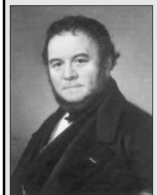
Stendhal cita la libreria nelle sue "Memoires"