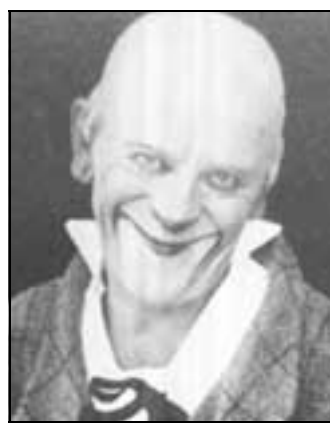
Grock il clown più celebre

Grock riuscì ad affascinare i bambini come i maggiori intel-