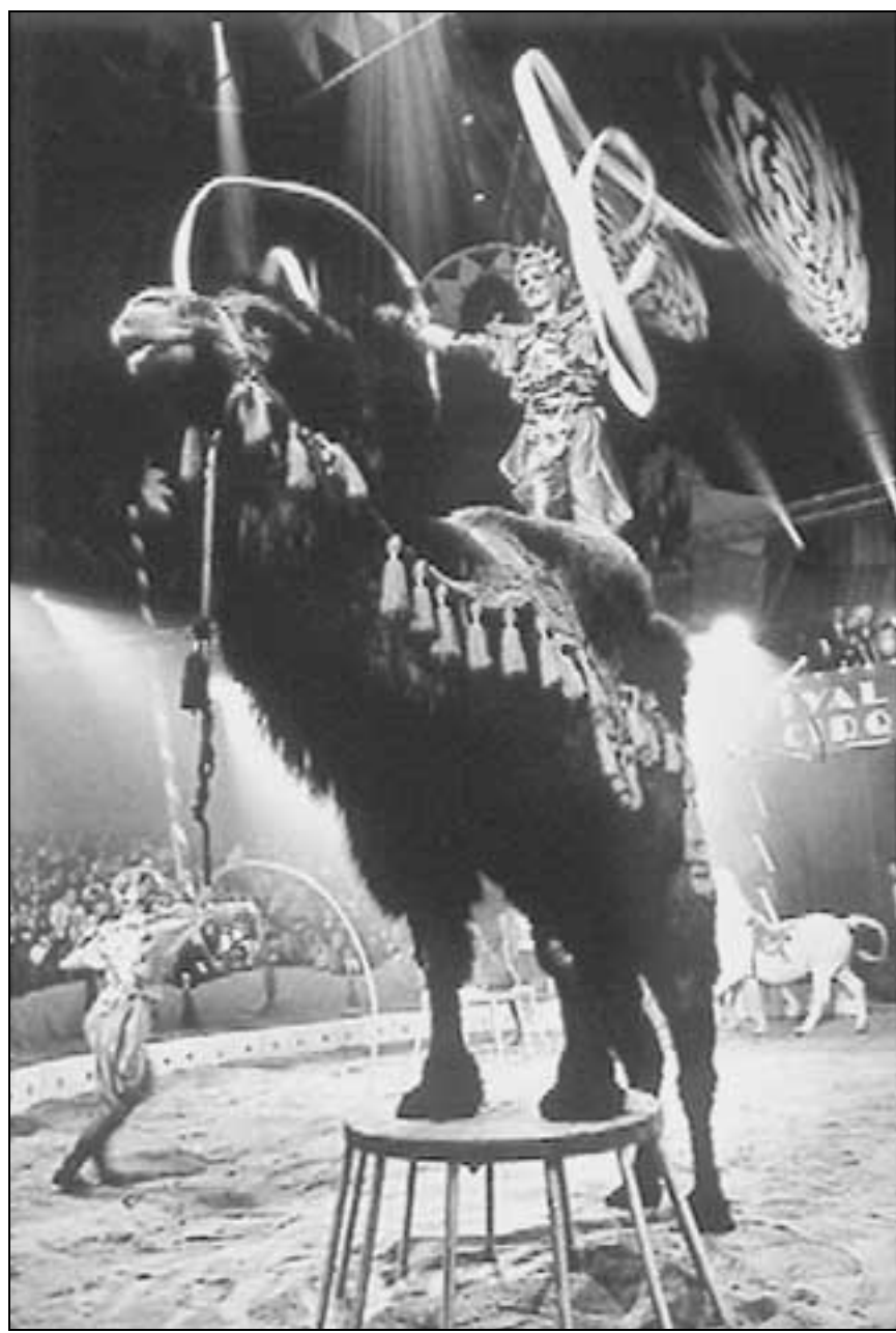
Il fascino del Circo grande spettacolo oggi finito in soffitta