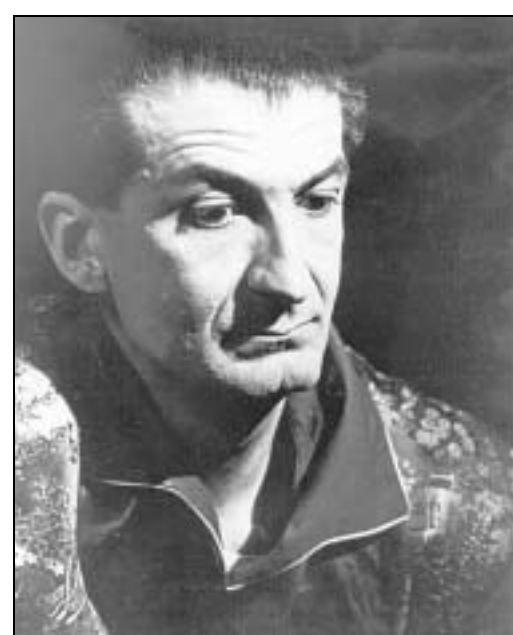
Giulio Cesare Castello

Un genovese può vincere anche il premio Nobel, ma per "sentirsi esistere", a un certo punto, per chissà quale ammalata stranezza, sembra debba avere bisogno di un segno d'assenso da Genova. Da quella città che con colpevole indifferenza lo ha fatto fuori. Il finale è quello di una sperimentata recita: quelli rimasti convengono che effettivamente, con le sue opere, l'esule ha onorato la "nostra città". Una dignità di cui si sentono orgogliosamente partecipi. Davanti al necrologio.