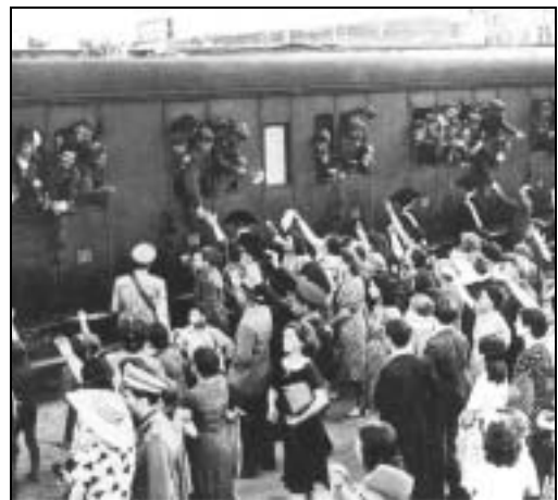
Soldati che partono per il fronte

Storie e testimonianze, mai retoriche, in un'antologia che riserva anche punte commoventi