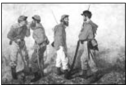
Garibaldini prima di una battaglia