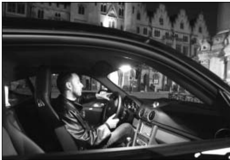
Sosta obbligata del viaggio-inchiesta alla Westminster Abbey