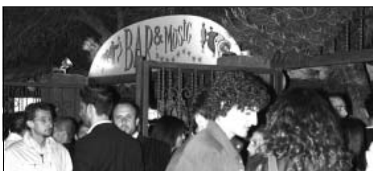
Il Ferrocarril locale caratteristico sul lungomare del Prino a Imperia