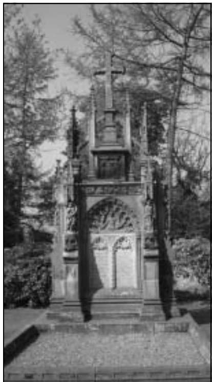
L'epilogo nella campagna scozzese